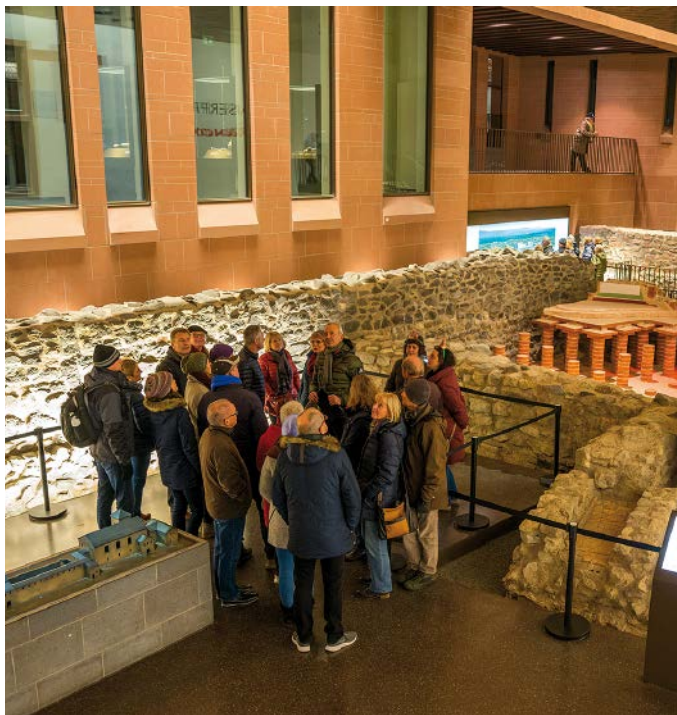
Kaiserpfalz franconofurd