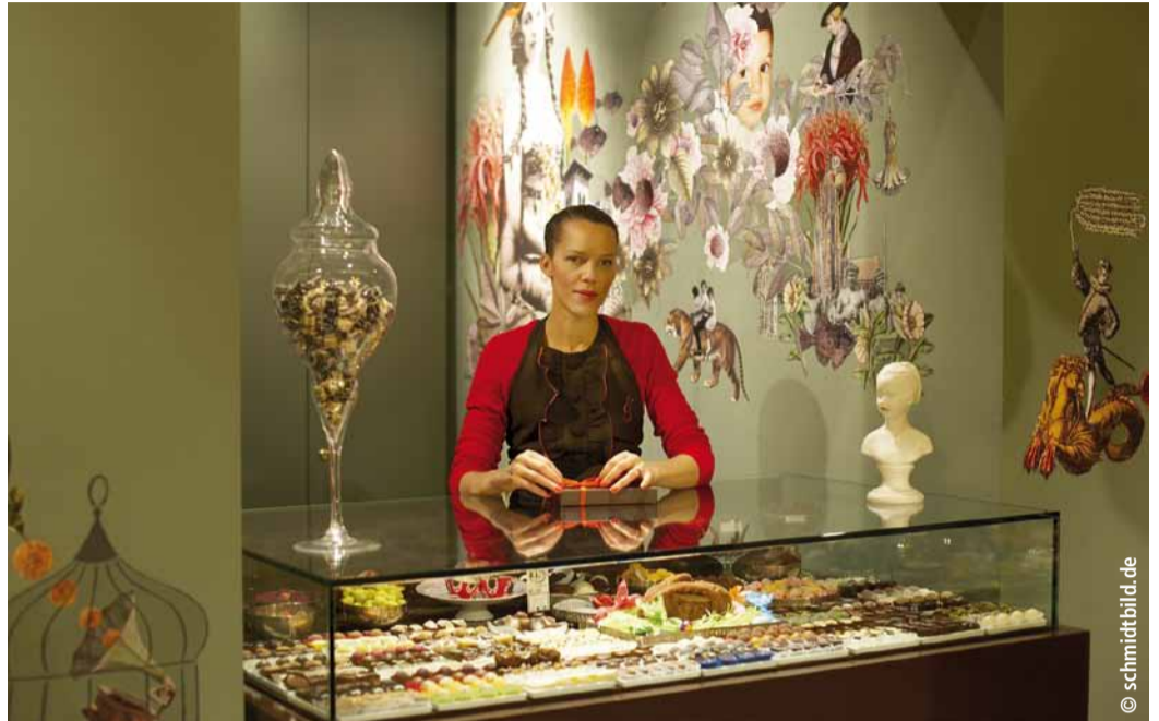
Handgefertigte Pralinen im Laden