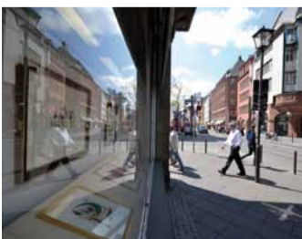
Kunst auf Schritt und Tritt

Die Braubachstraße polarisiert. Sie steht wie kaum eine andere Straße für Veränderung und Neuanfang in der Frankfurter Altstadt. Seit dem Abriss des Techni-