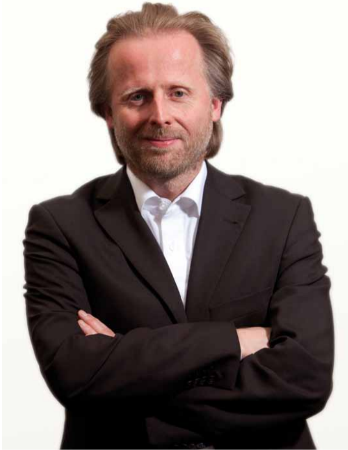
Bürgermeister Olaf Cunitz

Seit dem 15. März 2012 ist Olaf Cunitz Bürgermeister und Dezernent für Planen und Bauen in Frankfurt am Main. Die Gedanken des studierten Historikers zum DomRömer-Projekt interessieren Öffentlichkeit und Projektbeteiligte gleichermaßen. Der DomRömer Zeitung gab der Bürgermeister ein Interview.