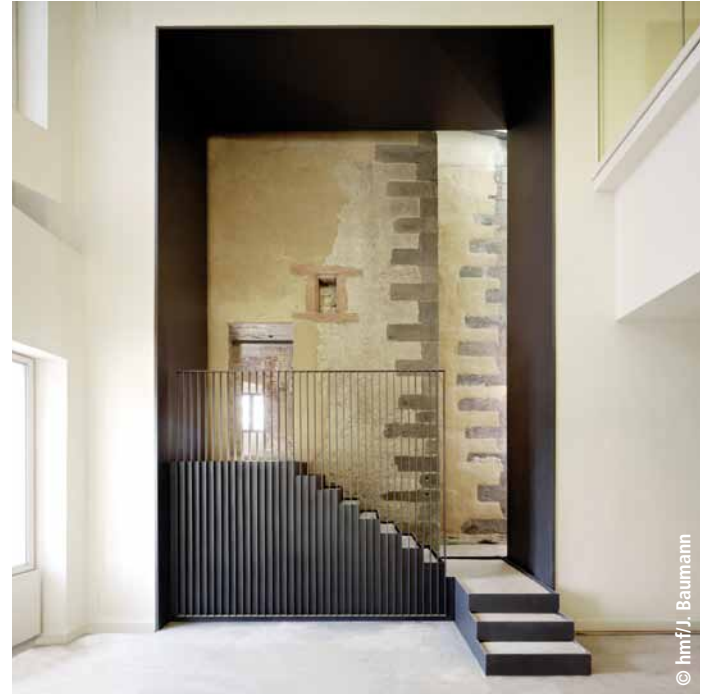
Zugang zum Rententurm

Im Saalhof sind wir während der Errichtung des Neubaus in den kommenden drei Jahren wieder präsent und bieten attraktive Ausstellungen und Veranstaltungen an. Und zwar mit einigen Spezialthemen, die viel mit unseren Sammlungen und Gebäuden zu tun haben: z.B. das „Mainpanorama“ im Rententurm mit Schlaglichtern auf den alten Mainhafen und das wichtige Fahrtor, das vom Rententurm seit 1456 bewacht wurde. Oder die Ausstellung „Stauferzeit“, die sich im Untergeschoss des Stauferbaus befindet, des ältesten Bauteils im renovierten Saalhof-Ensemble. Hier liegt der Ursprung der Stadt als Bürgergemeinde, denn in der Stauferzeit und durch die Förderung der staufischen Herrscher konnte sich um 1200 eine starke Kommune (Gemeinde) bilden, und zugleich liegt hier auch der Ursprung von Frankfurts beson-