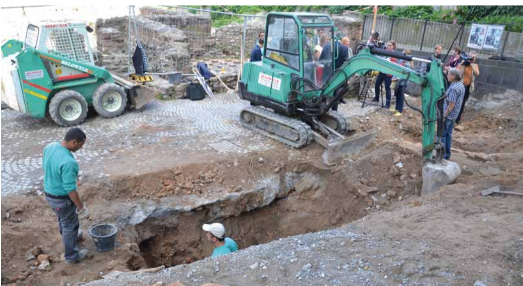
Mit leichtem Gerät wird im Bereich der Treppe gegraben

Im Zuge der Bauvorbereitung wird das an den Archäologischen Garten angrenzende Gebiet seit Mitte Mai von Denkmalamt und DomRömer GmbH gemeinsam untersucht. Die Arbeiten forderte das Denkmalamt. Die jetzige Durchführung ist für die Einhaltung des Zeitplans notwendig.