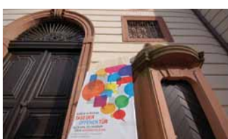
Bürgerbeteiligung im Fokus

Knapp 20.000 Menschen nutzten die Tage der offenen Tür am letzten Aprilwochenende und statteten dem Römer einen Besuch ab. Sie informierten sich über die Arbeit von Politik und Verwaltung, machten das Rathaus zu einem quirligen Treffpunkt. Auch das DomRömer-Projekt war präsent.