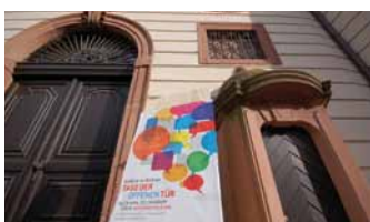
Bürgerbeteiligung im Fokus

Knapp 20.000 Menschen nutzten die Tage der offenen Tür am letzten Aprilwochenende und statteten dem Römer einen Besuch ab. Sie informierten sich über die Arbeit von Politik und Verwaltung, machten das Rathaus zu einem quirligen Treffpunkt. Auch das DomRömer-Projekt war präsent.