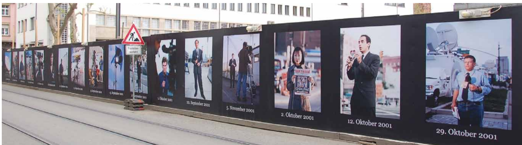
Fotogalerie am Bauzaun

Entlang der Braubachstraße wird derzeit der nördliche Bauzaun am DomRömer-Areal als Open-Air-Fotogalerie genutzt.