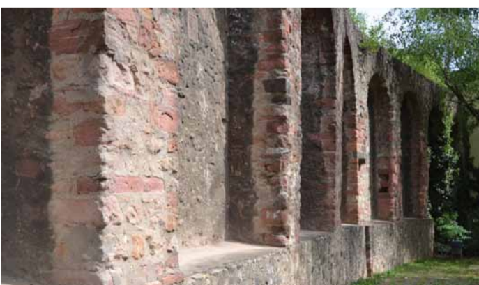
Teilstück des Befestigungsringes an der Fahrgasse

Im Gegensatz zu anderen Städten verfügt Frankfurt nur noch über wenige Reste seiner ehemaligen Stadtmauer. Ein Teilstück der sieben Meter hohen Schutzmauer können Spurensucher an der Fahrgasse noch finden.