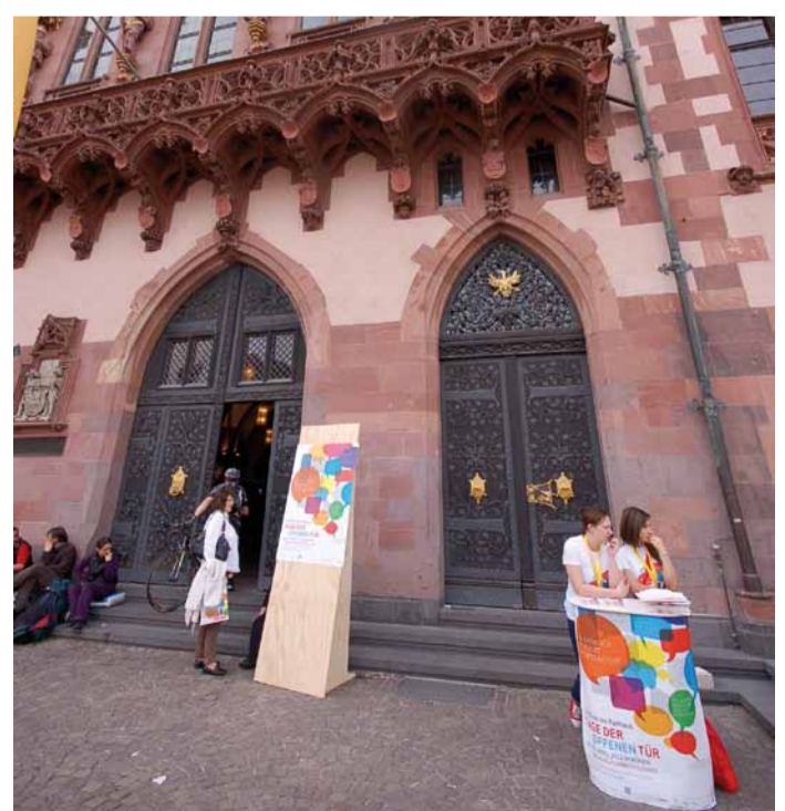
Offen für alle – der Römer

Neben den Interessenten staunten viele Familien mit Kindern über das Altstadtprojekt. Touristen, besonders die weit gereisten aus den USA, Indien oder Spanien, waren begeistert und gaben durchgehend ein sehr positives Feedback.