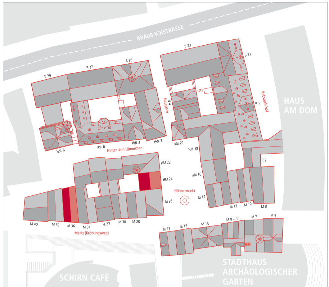
Die Lage der beiden Häuser im DomRömer-Areal

Die Vielfalt unterschiedlicher Architekturen im DomRömer-Areal wird beim Blick auf einzelne Häuser deutlich. Die Rekonstruktion Hühnermarkt 24 und der Neubau Markt 36 in der Gegenüberstellung.