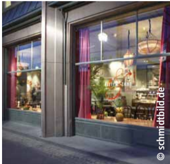
Einladend: der Salon

Gourmets können bei Bitter & Zart voll auf ihre Kosten kommen. Auf 200 Quadratmetern befinden sich eine Chocolaterie und ein Salon. Der Salon ist ein Kaffeehaus der besonderen