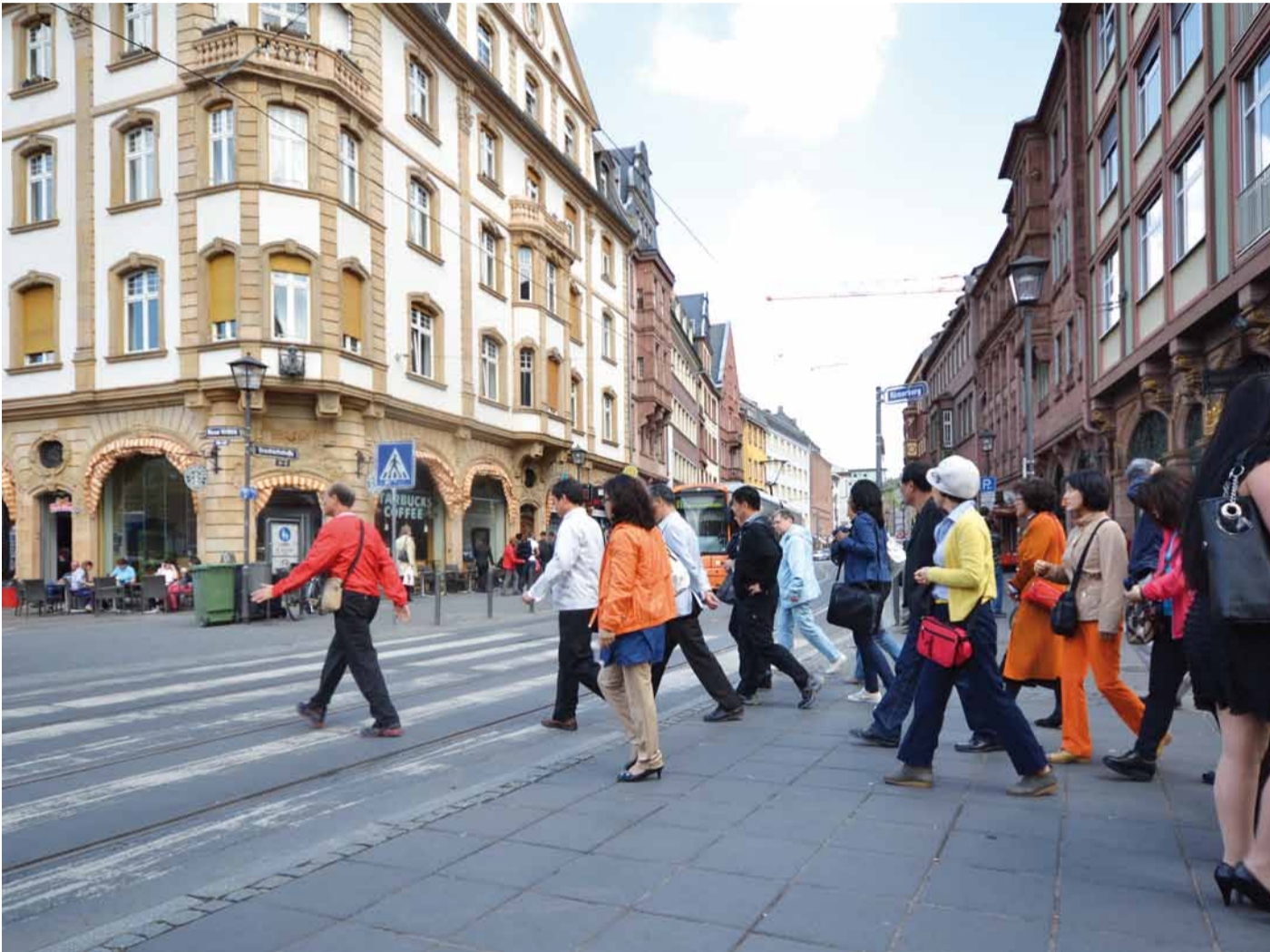
Braubachstraße, Blick in Richtung Osten