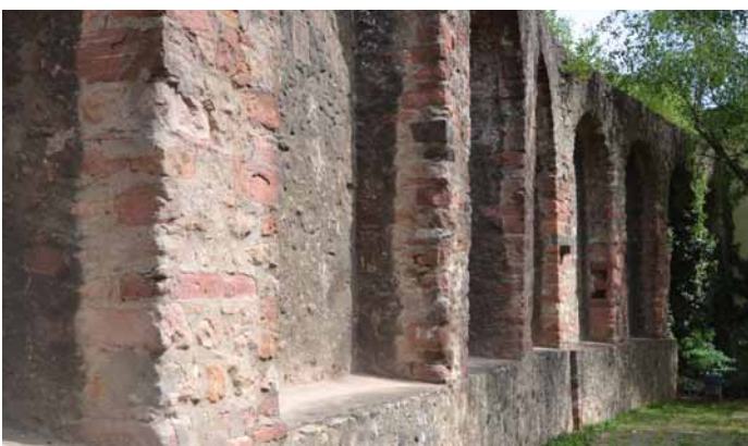
Teilstück des Befestigungsringes an der Fahrgasse

Im Gegensatz zu anderen Städten verfügt Frankfurt nur noch über wenige Reste seiner ehemaligen Stadtmauer. Ein Teilstück der sieben Meter hohen Schutzmauer können Spurensucher an der Fahrgasse noch finden.