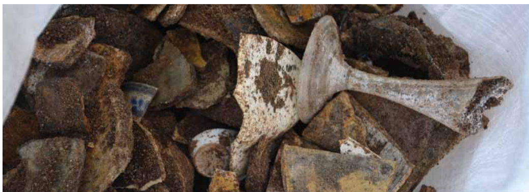
Alle ausgegrabenen Fundstücke werden anschließend dokumentiert

von Mitarbeitern des Denkmalamts dokumentiert. Danach erst wird entschieden, ob und wie die Funde in der weiteren Planung für die südliche Bebauung des DomRömer-Quartiers berücksichtigt werden sollen. Für Besucher des Bodendenkmals ergeben sich durch die Sucharbeiten keine Einschränkungen – der Archäologische Garten bleibt während der Untersuchungsarbeiten ungehindert zugänglich.