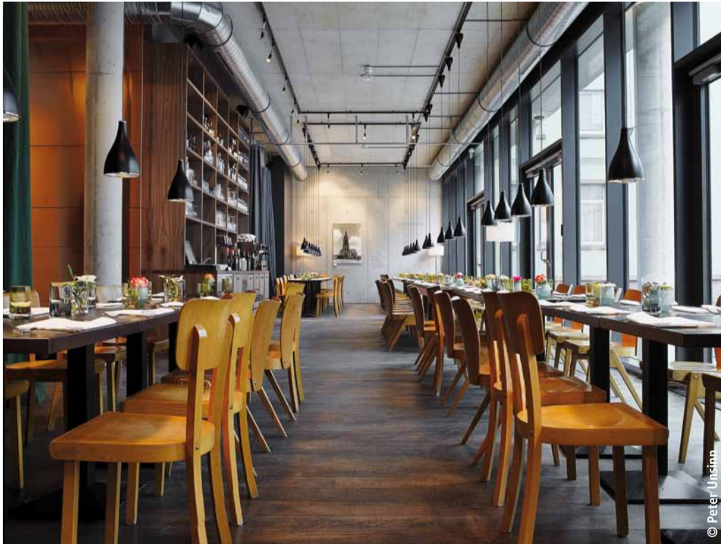
Margarete bietet zahlreiche Sitzplätze im Innen- und Außenbereich

Das im März 2012 eröffnete Restaurant Margarete bewirtschaftet die Gastronomiefläche im neuen Haus des Buches in der Braubachstraße 16.