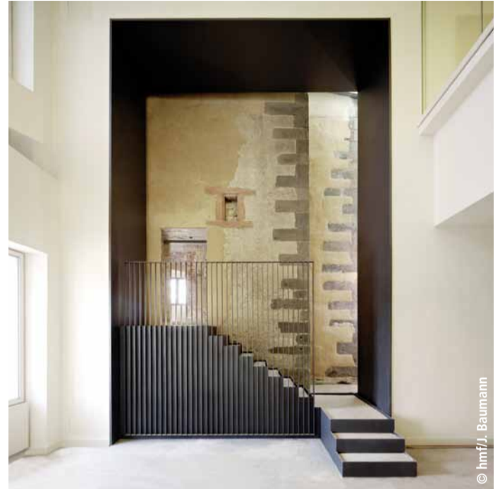
Zugang zum Rententurm

Im Saalhof sind wir während der Errichtung des Neubaus in den kommenden drei Jahren wieder präsent und bieten attraktive Ausstellungen und Veranstaltungen an. Und zwar mit einigen Spezialthemen, die viel mit unseren Sammlungen und Gebäuden zu tun haben: z.B. das „Mainpanorama“ im Rententurm mit Schlaglichtern auf den alten Mainhafen und das wichtige Fahrtor, das vom Rententurm seit 1456 bewacht wurde. Oder die Ausstellung „Stauferzeit“, die sich im Untergeschoss des Stauferbaus befindet, des ältesten Bauteils im renovierten Saalhof-Ensemble. Hier liegt der Ursprung der Stadt als Bürgergemeinde, denn in der Stauferzeit und durch die Förderung der staufischen Herrscher konnte sich um 1200 eine starke Kommune (Gemeinde) bilden, und zugleich liegt hier auch der Ursprung von Frankfurts beson-