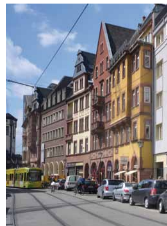
Auf der Altstadtstrecke verkehren die Straßenbahn-Linien 11 und 12

Hier grenzt auch die wichtigste Verbindung zwischen Lieb-